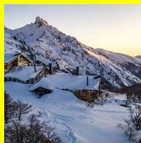
El increíble Baguales.

Pero si hay un lugar de donde se habla desde hace rato “de los qataríes”, ese lugar no es Buenos Aires, sino Bariloche . Hay que fechar en 2017 aproximadamente el desembarco del Emir en la Patagonia. Como suele suceder, se instala primero el mito de una presencia poderosa y finalmente se descorre el velo de una operación de inmobiliaria. Eso pasó en Baguales, a 50 kilómetros de Bariloche. Como las compras se hacen en zonas de “seguridad de frontera” y por la ley de tierras un extranjero no puede ser dueño de directo de tierras de estas características en el país, las compras se hacen a través de complejas, pero legales, conformaciones societarias.