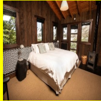
Lujo en Baguales.

Baguales es el nombre con que Burco explotaba comercialmente desde hace años la “ mesada Baguales ”, una suerte de estepa de altura a 1.700 metros sobre el nivel del mar que se carga de nieve buena parte del año. Caviar para esquiadores. Es la misma zona del Cerro Carreras, que en los papeles figura como propiedad del grupo Burco y de la estancia Alto Foyel. Desde comienzos de los 2000, el grupo Burco ofrece el servicio exclusivo de heliesquí en la zona que ahora está bajo control de Gaudio y del Emir. Se estiman que en total, el Emir posee, mediante una trama de diferentes sociedades, un total de 28 mil hectáreas.